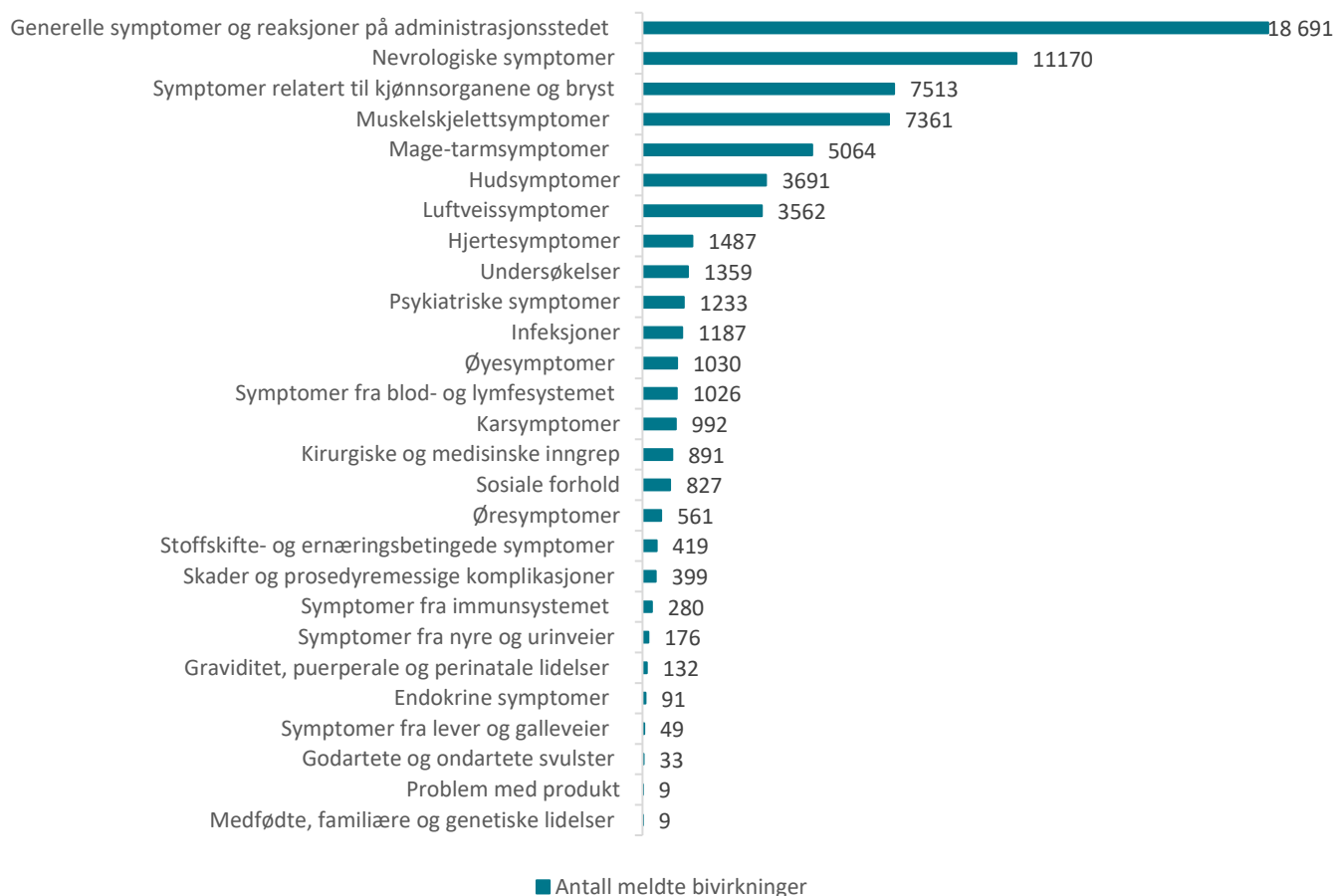
Tabell 6: Meldte mistenkte bivirkninger fordelt etter kategori for Comirnaty og Spikevax

En melding kan inneholde flere bivirkninger og dermed er det langt flere bivirkninger enn meldinger.