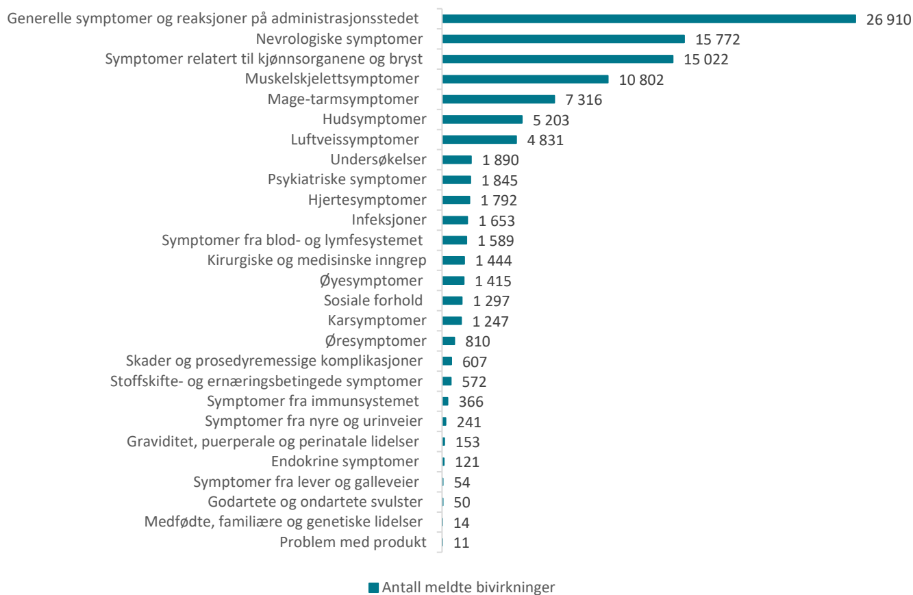
Tabell 7: Meldte mistenkte bivirkninger fordelt etter kategori for Comirnaty og Spikevax

En melding kan inneholde flere bivirkninger og dermed er det langt flere bivirkninger enn meldinger.