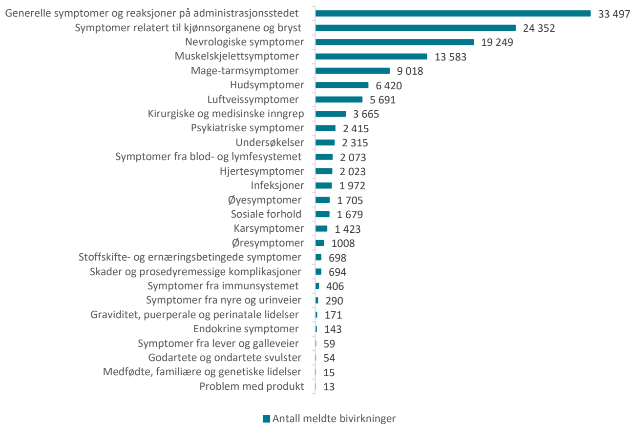
Tabell 7: Meldte mistenkte bivirkninger fordelt etter kategori for Comirnaty og Spikevax

En melding kan inneholde flere bivirkninger og dermed er det langt flere bivirkninger enn meldinger.